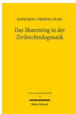
Das Sharenting in der Zivilrechtsdogmatik Ladenpreis: 81,30EUR