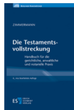
Die Testamentsvollstreckung Ladenpreis: 100,80EUR