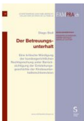
Der Betreuungsunterhalt Ladenpreis: 108,20EUR