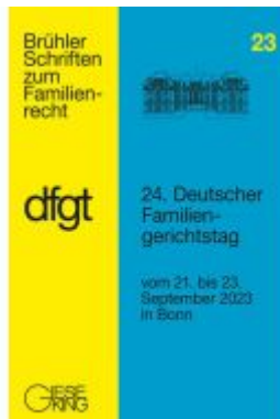
24. Deutscher Familiengerichtstag Ladenpreis: 40,10EUR

Wir haben andere Produkte gefunden, die Ihnen gefallen könnten!