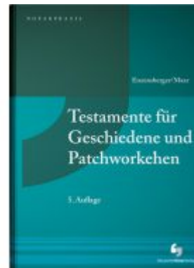
Testamente für Geschiedene und Patchworkhefen Ladenpreis: 50,40EUR