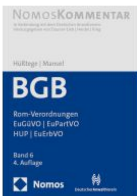
Bürgerliches Gesetzbuch: Rom-Verordnungen - EuGÜVO - EuPartVO - HUP - EuErbVO Ladenpreis: 204,60EUR