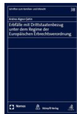
Erbfälle mit Drittstaatenbezug unter dem Regime der Europäischen Erbrechtsverordnung Ladenpreis: 112,10EUR