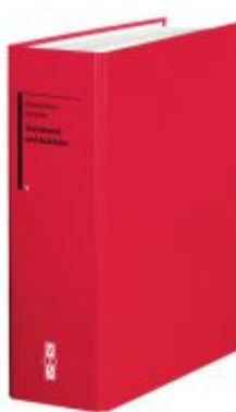
Standesamt und Ausländer Ladenpreis: 123,40EUR