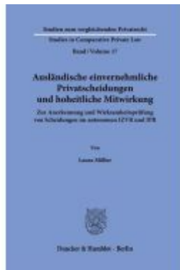
Ausländische einvernehmliche Privatscheidungen und hoheitliche Mitwirkung. Ladenpreis: 113,00EUR