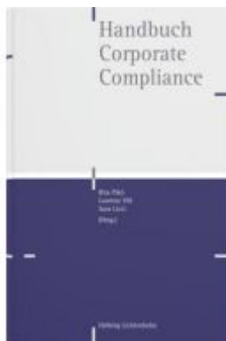
Handbuch Corporate Compliance Ladenpreis: 515,00EUR