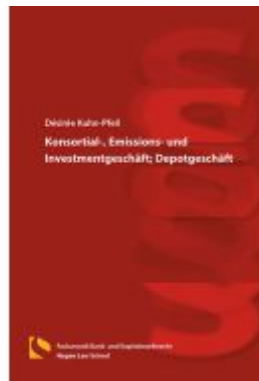
Konsortial-, Emissions- und Investmentgeschäft; Depotgeschäft Ladenpreis: 36,00EUR