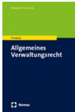
Allgemeines Verwaltungsrecht Ladenpreis: 27,70EUR