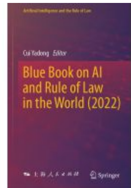
Blue Book on AI and Rule of Law in the World (2022) Ladenpreis: 164,99EUR