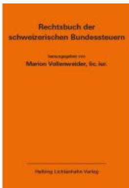
Rechtsbuch der schweizerischen Bundessteuern EL 181 Ladenpreis: 339,00EUR