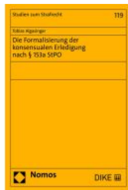
Die Formalisierung der konsensualen Erledigung nach § 153a StPO Ladenpreis: 104,00EUR