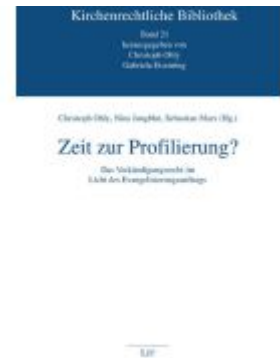
Zeit zur Profilierung? Ladenpreis: 24,90EUR