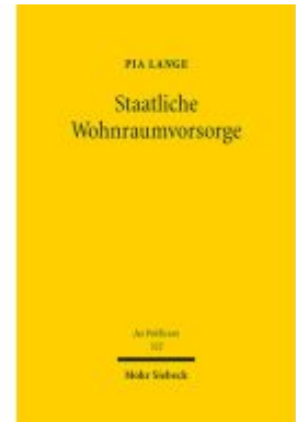
Staatliche Wohnraumvorsorge Ladenpreis: 127,50EUR