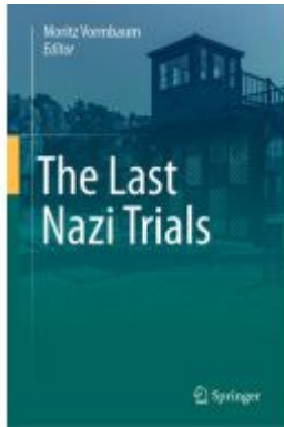
The Last Nazi Trials Ladenpreis: 175,99EUR