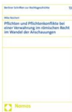
Pflichten und Pflichtenkonflikte bei einer Verwahrung im römischen Recht im Wandel der Anschauungen Ladenpreis: 81,30EUR