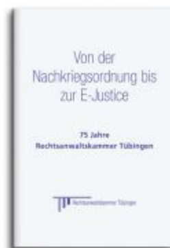
Von der Nachkriegsordnung bis zur E- Justice Ladenpreis: 41,20EUR