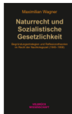
Naturrecht und Sozialistische Gesetzlichkeit Ladenpreis: 44,90EUR