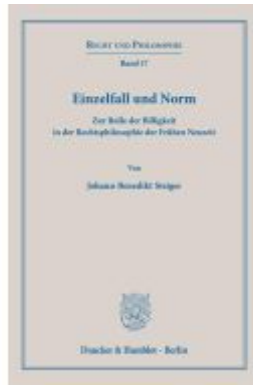
Einzelfall und Norm Ladenpreis: 102,70EUR