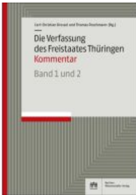
Die Verfassung des Freistaates Thüringen Ladenpreis: 194,30EUR