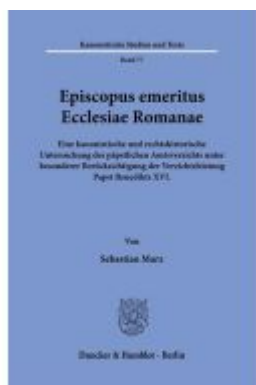
Episcopus emeritus Ecclesiae Romanae. Ladenpreis: 113,00EUR