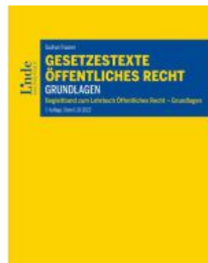
Gesetzestexte Öffentliches Recht - Grundlagen Ladenpreis: 32,00EUR