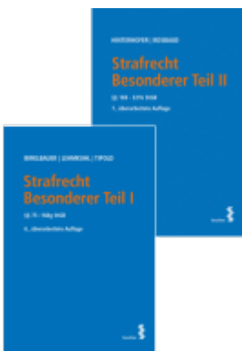
Kombipaket Strafrecht Besonderer Teil I und Besonderer Teil II Ladenpreis: 82,00EUR