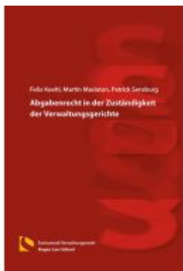
Abgabenrecht in der Zuständigkeit der Verwaltungsgerichte Ladenpreis: 60,60EUR