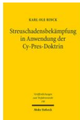
Streuschadensbekämpfung in Anwendung der Cy-Pres-Doktrin Ladenpreis: 107,00EUR