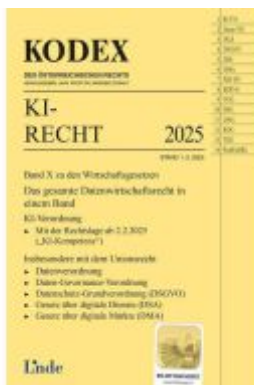
KODEX KI-Recht Ladenpreis: 24,00EUR