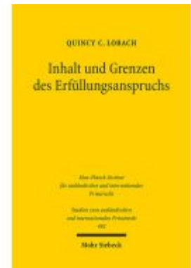
Inhalt und Grenzen des Erfüllungsanspruchs Ladenpreis: 86,40EUR