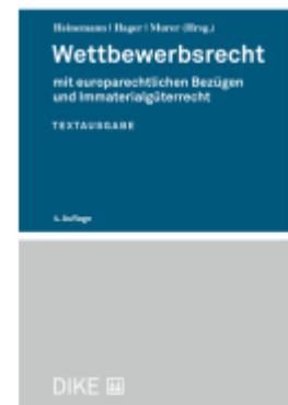
Wettbewerbsrecht Ladenpreis: 64,00EUR