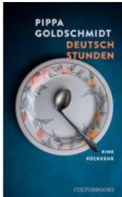
Deutschstunden Ladenpreis: 24,70EUR