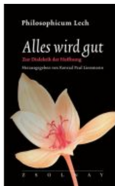
Alles wird gut Ladenpreis: 26,80EUR