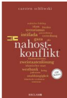
Nahostkonflikt. 100 Seiten Ladenpreis: 10,30EUR