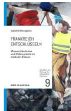
Frankreich entschlüsseln Ladenpreis: 23,70EUR