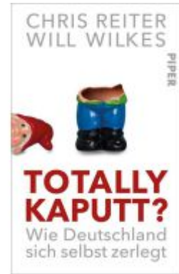
Totally kaputt? Ladenpreis: 24,70EUR