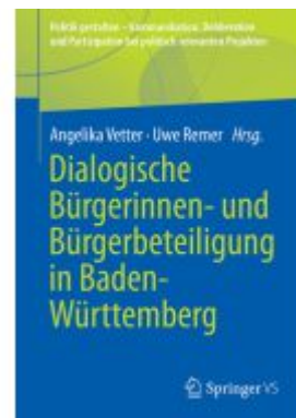
Dialogische Bürgerinnen- und Bürgerbeteiligung in Baden-Württemberg Ladenpreis: 71,95EUR