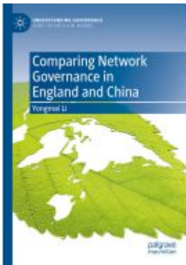
Comparing Network Governance in England and China Ladenpreis: 131,99EUR