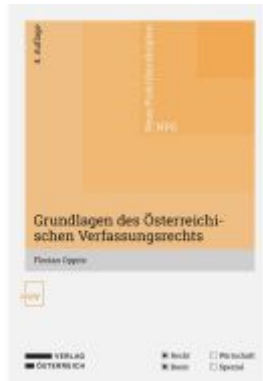
Grundlagen des Österreichischen Verfassungsrechts Ladenpreis: 20,00EUR