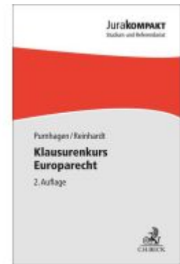
Klausurenkurs Europarecht Ladenpreis: 13,30EUR