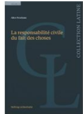
La responsabilité civile du fait des choses Ladenpreis: 97,00EUR