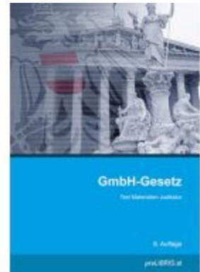
GmbH-Gesetz Ladenpreis: 28,00EUR