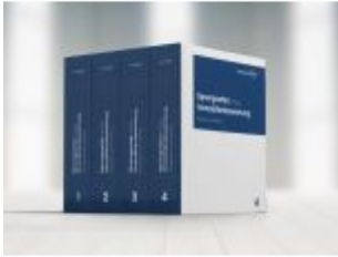
Immobilienbewertung - Marktdaten und Praxishilfen Ladenpreis: 199,00EUR