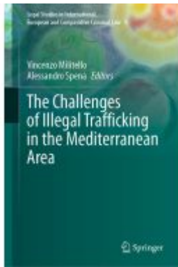
The Challenges of Illegal Trafficking in the Mediterranean Area Ladenpreis: 164,99EUR