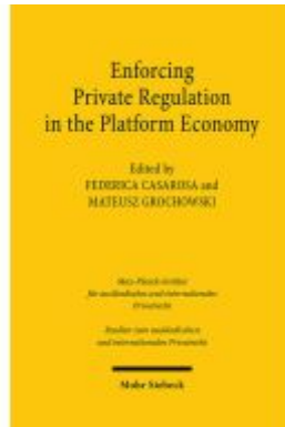
Enforcing Private Regulation in the Platform Economy Ladenpreis: 91,50EUR