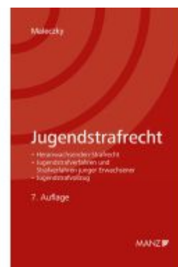
Jugendstrafrecht Ladenpreis: 44,00EUR