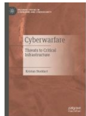
Cyberwarfare Ladenpreis: 142,99EUR