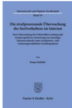
Die strafprozessuale Überwachung des Surfverhaltens im Internet. Ladenpreis: 92,50EUR