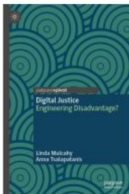
Digital Justice Ladenpreis: 43,99EUR