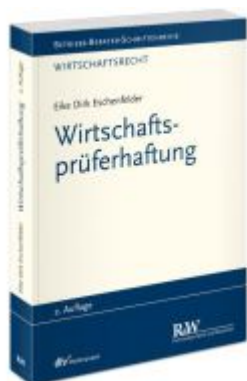
Wirtschaftsprüferhaftung Ladenpreis: 91,50EUR