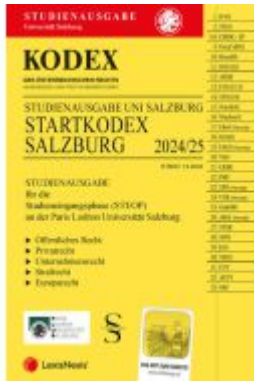
KODEX Startkodex Salzburg 2024/25 - inkl. App Ladenpreis: 21,00EUR