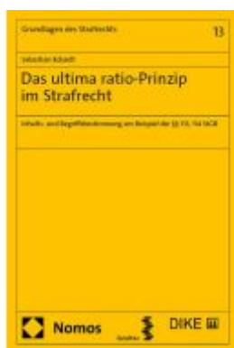
Das ultima ratio-Prinzip im Strafrecht Ladenpreis: 112,10EUR