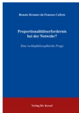
Proportionalitätserfordernis bei der Notwehr? Ladenpreis: 101,60EUR