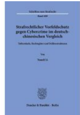
Strafrechtlicher Vorfeldschutz gegen Cybercrime im deutsch-chinesischen Vergleich. Ladenpreis: 92,50EUR