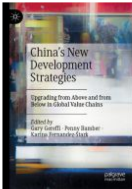
China's New Development Strategies Ladenpreis: 109,99EUR