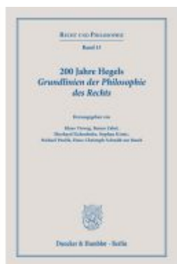
200 Jahre Hegels Grundlinien der Philosophie des Rechts. Ladenpreis: 92,50EUR