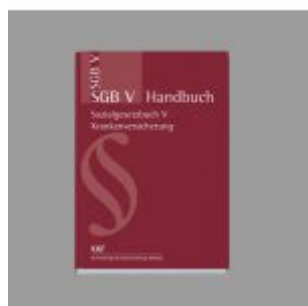
SGB V Handbuch Ladenpreis: 63,70EUR