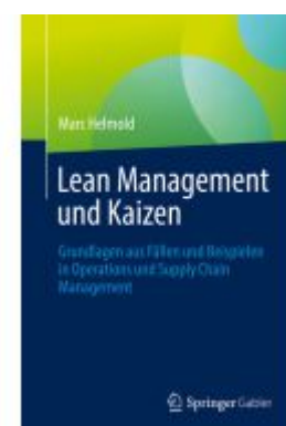
Lean Management und Kaizen Ladenpreis: 56,53EUR