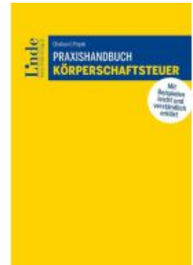
Praxishandbuch Körperschaftsteuer Ladenpreis: 59,00EUR