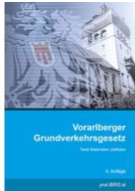
Vorarlberger Grundverkehrsgesetz Ladenpreis: 23,00EUR