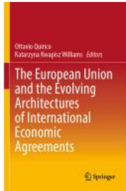
The European Union and the Evolving Architectures of International Economic Agreements Ladenpreis: 186,99EUR