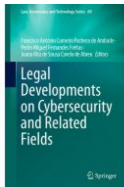
Legal Developments on Cybersecurity and Related Fields Ladenpreis: 186,99EUR