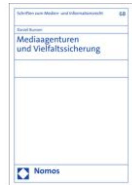
Mediaagenturen und Vielfaltssicherung Ladenpreis: 112,10EUR