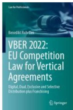
VBER 2022: EU Competition Law for Vertical Agreements Ladenpreis: 87,99EUR