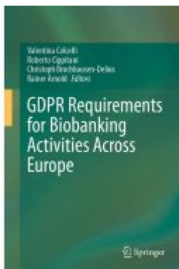
GDPR Requirements for Biobanking Activities Across Europe Ladenpreis: 252,99EUR