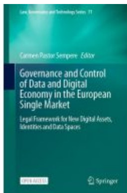
Governance and Control of Data and Digital Economy in the European Single Market Ladenpreis: 54,99EUR