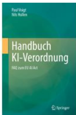
Handbuch KI-Verordnung Ladenpreis: 71,95EUR