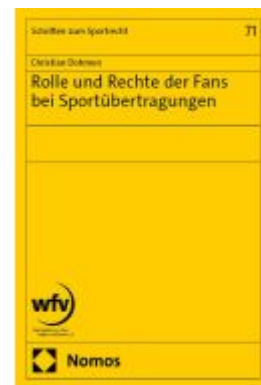
Rolle und Rechte der Fans bei Sportübertragungen Ladenpreis: 158,40EUR