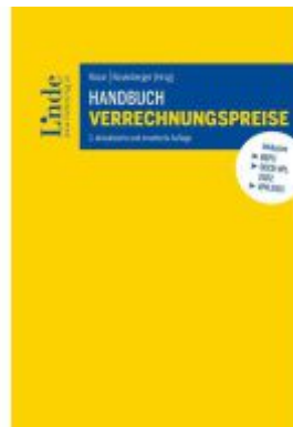
Handbuch Verrechnungspreise Ladenpreis: 158,00EUR