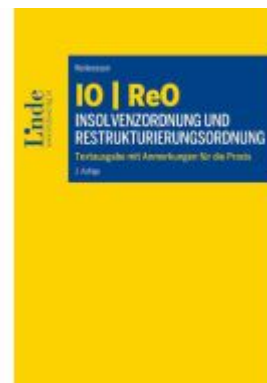
IO | ReO Insolvenzordnung und Restrukturierungsordnung Ladenpreis: 89,00EUR