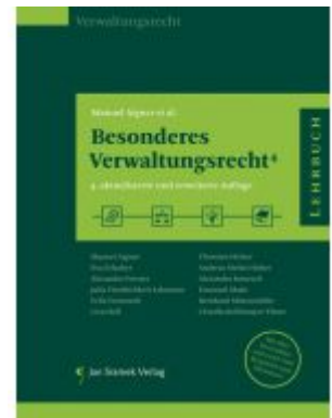
SET Fallbuch Öffentliches Recht und Besonderes Verwaltungsrecht 4. Auflage Ladenpreis: 78,00EUR