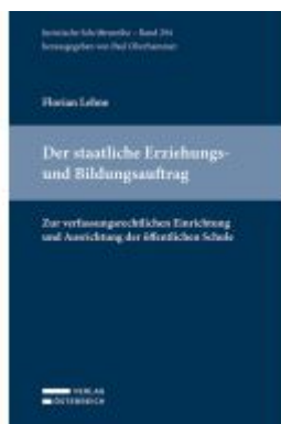
Der staatliche Erziehungs- und Bildungsauftrag Ladenpreis: 72,00EUR