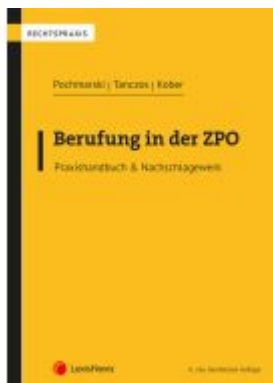
Berufung in der ZPO Ladenpreis: 55,00EUR

Wir haben andere Produkte gefunden, die Ihnen gefallen könnten!