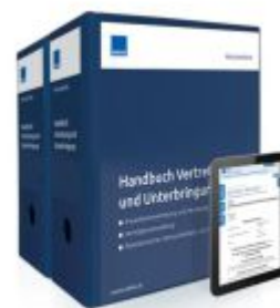
Handbuch Vertretung und Unterbringung Ladenpreis: 261,80EUR