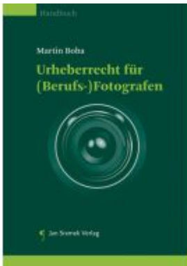
Urheberrecht für (Berufs-)Fotografen Ladenpreis: 55,00EUR