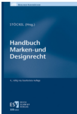
Handbuch Marken- und Designrecht Ladenpreis: 121,40EUR

Wir haben andere Produkte gefunden, die Ihnen gefallen könnten!