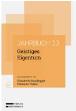
Geistiges Eigentum Ladenpreis: 78,00EUR