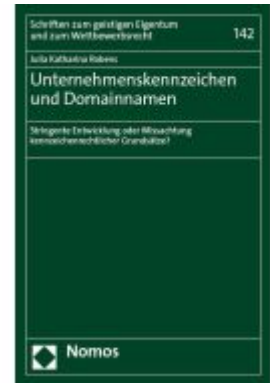
Unternehmenskennzeichen und Domainnamen Ladenpreis: 91,50EUR