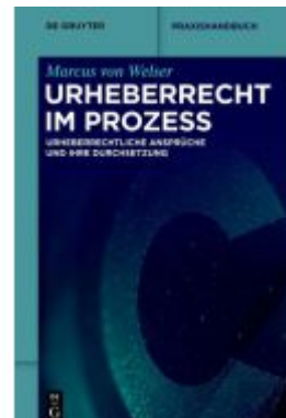
Urheberrecht im Prozess Ladenpreis: 59,95EUR