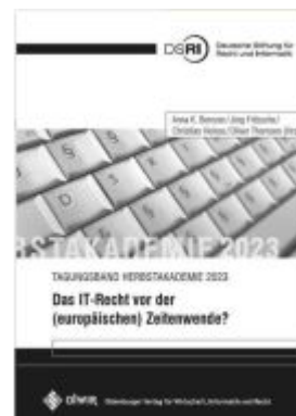
Das IT-Recht vor der (europäischen) Zeitenwende? Ladenpreis: 71,80EUR