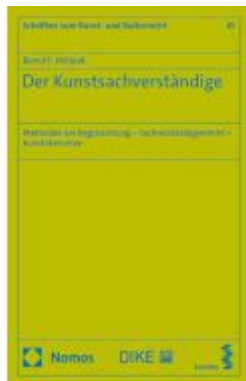
Der Kunstsachverständige Ladenpreis: 142,90EUR