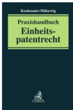
Praxishandbuch Einheitspatentrecht Ladenpreis: 122,40EUR