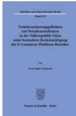
Verkehrssicherungspflichten von Netzdienstleistern in der Volksrepublik China unter besonderer Berücksichtigung der E-Commerce-Plattform-Betreiber. Ladenpreis: 82,20EUR