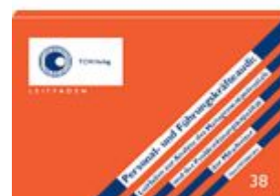
Personal- und Führungskräfteaudit Ladenpreis: 257,10EUR