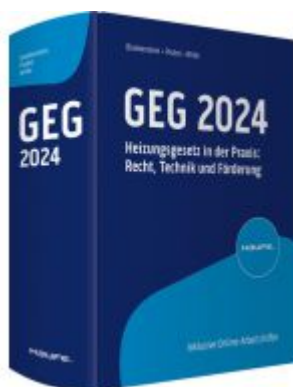
GEG 2024 Ladenpreis: 100,80EUR