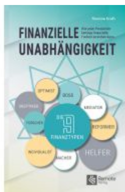
Finanzielle Unabhängigkeit Ladenpreis: 26,99EUR