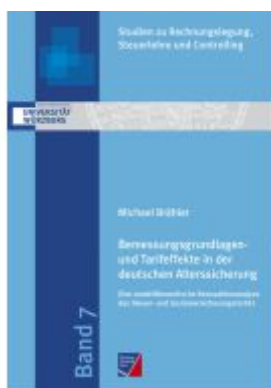
Bemessungsgrundlagen- und Tarifeffekte in der deutschen Alterssicherung Ladenpreis: 33,90EUR