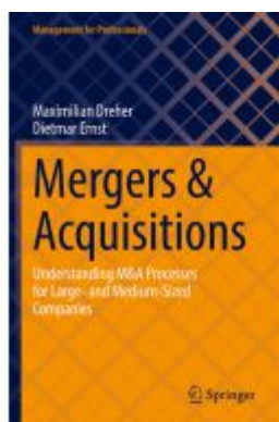
Mergers & Acquisitions Ladenpreis: 65,99EUR