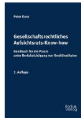
Gesellschaftsrechtliches Aufsichtsrats- Know-how Ladenpreis: 68,00EUR