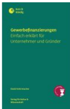
Gewerbefinanzierungen Ladenpreis: 18,50EUR