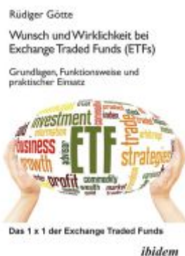
Wunsch und Wirklichkeit bei Exchange Traded Funds (ETFs): Grundlagen, Funktionsweise und praktischer Einsatz Ladenpreis: 41,00EUR