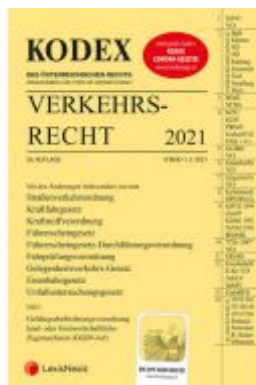
KODEX Verkehrsrecht 2021