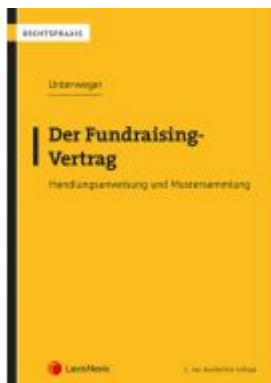
Der Fundraising-Vertrag Ladenpreis: 27,00 EUR

Wir haben andere Produkte gefunden, die Ihnen gefallen könnten!