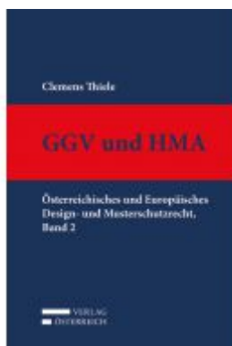
GGV und HMA Ladenpreis: 329,00 EUR