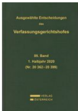
Ausgewählte Entscheidungen des Verfassungsgerichtshofes Ladenpreis: 259,00 EUR