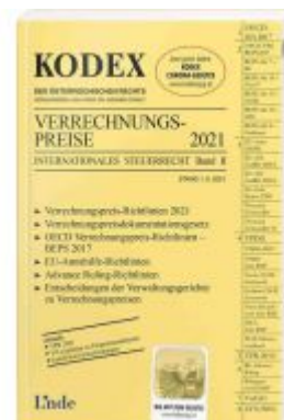
KODEX Verrechnungspreise 2021/22 Ladenpreis: 60,00 EUR