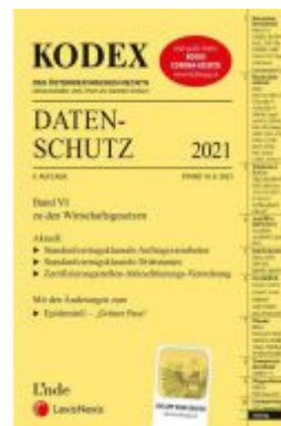
KODEX Datenschutz 2021