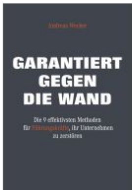
Garantiert gegen die Wand Ladenpreis: 25,60EUR