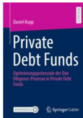
Private Debt Funds Ladenpreis: 82,23EUR