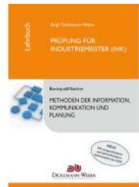
Industriemeister - Lehrbuch: Methoden der Information, Kommunikation und Planung - Tabellenbuch IKP Ladenpreis: 27,95EUR