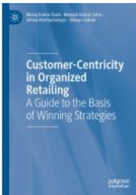
Customer-Centricity in Organized Retailing Ladenpreis: 93,49EUR