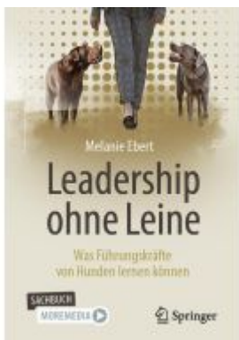
Leadership ohne Leine Ladenpreis: 25,69EUR