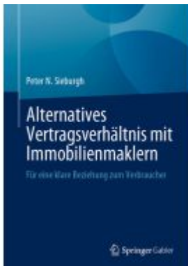
Alternatives Vertragsverhältnis mit Immobilienmaklern Ladenpreis: 66,81EUR

Wir haben andere Produkte gefunden, die Ihnen gefallen könnten!