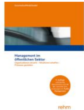
Management im öffentlichen Sektor Ladenpreis: 39,10EUR