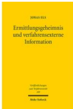
Ermittlungsgeheimnis und verfahrensexterne Information Ladenpreis: 112,10EUR