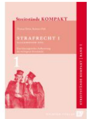
Streitstände Kompakt / Streitstände Kompakt - Band 1 - Strafrecht 1 Allgemeiner Teil Ladenpreis: 11,10EUR