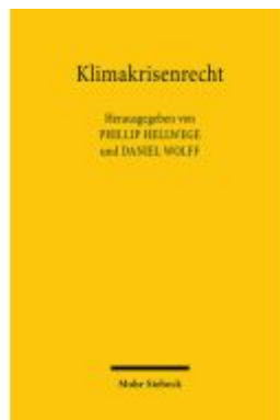
Klimakrisenrecht Ladenpreis: 91,50EUR