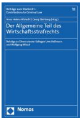
Der Allgemeine Teil des Wirtschaftsstrafrechts Ladenpreis: 81,30EUR