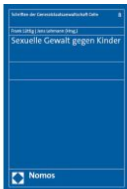
Sexuelle Gewalt gegen Kinder Ladenpreis: 29,90EUR