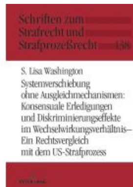
Systemverschiebung ohne Ausgleichmechanismen: Konsensuale Erledigungen und Diskriminierungseffekte im Wechselwirkungsverhältnis Ladenpreis: 71,90EUR