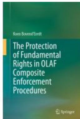
The Protection of Fundamental Rights in OLAF Composite Enforcement Procedures Ladenpreis: 197,99EUR