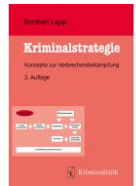
Kriminalstrategie Ladenpreis: 28,80EUR