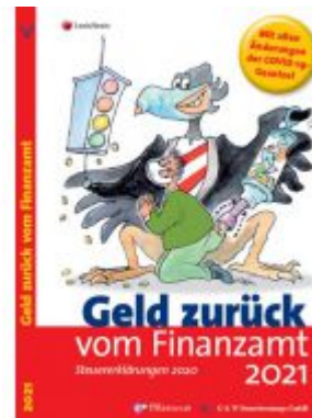
Geld zurück vom Finanzamt 2021 Ladenpreis: 19,90 EUR