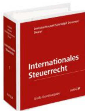
Internationales Steuerrecht Ladenpreis: 448,00 EUR