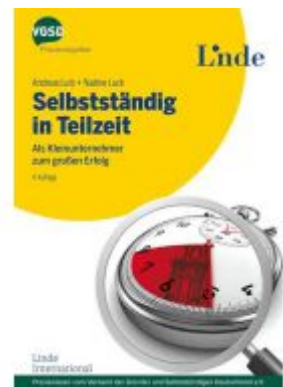
Selbstständig in Teilzeit Ladenpreis: 24,90 EUR