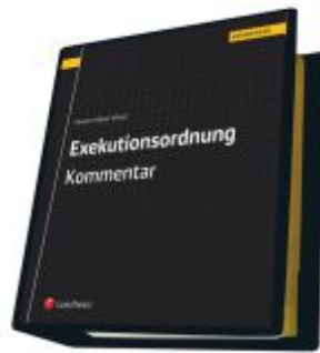
Exekutionsordnung - Kommentar Ladenpreis: 623,00 EUR