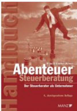
Abenteuer Steuerberatung Ladenpreis: 59,00 EUR