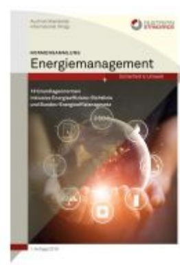
Normensammlung Energiemanagement Ladenpreis: 262,90 EUR