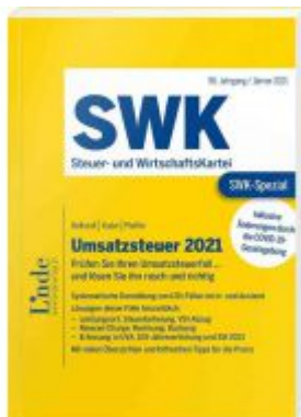
SWK-Spezial Umsatzsteuer 2021 Ladenpreis: 52,00 EUR

Wir haben andere Produkte gefunden, die Ihnen gefallen könnten!