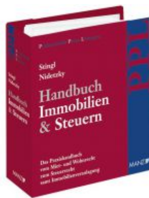
PAKET: Handbuch Immobilien & Steuern Ladenpreis: 240,00 EUR