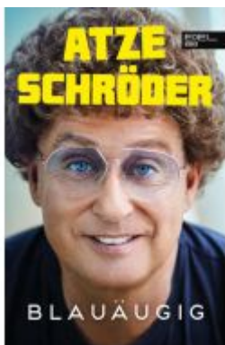
Blauäugig Ladenpreis: 13,40EUR