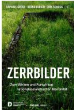
Zerrbilder Ladenpreis: 30,90EUR