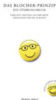
Das Blocher-Prinzip. Ein Führungsbuch Ladenpreis: 29,90EUR