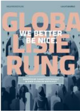
Megatrendstudie Globalisierung Ladenpreis: 150,00EUR