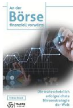
An der Börse finanziell vorwärts Ladenpreis: 19,99EUR