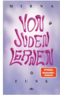
Von Juden lernen Ladenpreis: 18,50EUR