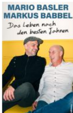
Das Leben nach den besten Jahren Ladenpreis: 25,00EUR

Wir haben andere Produkte gefunden, die Ihnen gefallen könnten!