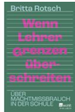
Wenn Lehrer Grenzen überschreiten Ladenpreis: 18,50EUR