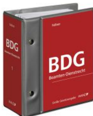
Beamten-Dienstrechtsgesetz Ladenpreis: 375,00EUR