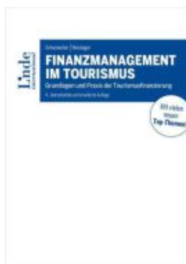
Finanzmanagement im Tourismus Ladenpreis: 50,00EUR