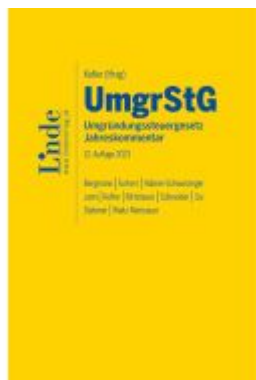
UmgrStG | Umgründungssteuergesetz 2023 Ladenpreis: 255,00EUR