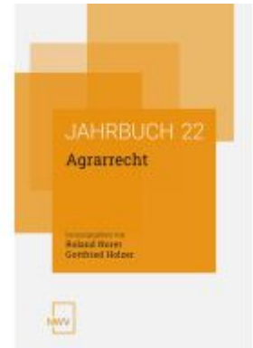
Agrarrecht Ladenpreis: 74,00EUR