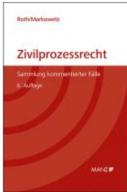
Zivilprozessrecht Sammlung kommentierter Fälle Ladenpreis: 46,00EUR