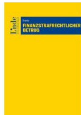
Finanzstrafrechtlicher Betrug Ladenpreis: 59,00EUR