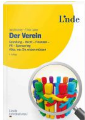
Der Verein Ladenpreis: 16,90EUR