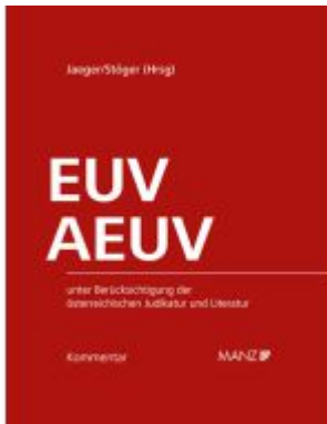
Kommentar zu EUV und AEUV Ladenpreis: 398,00EUR