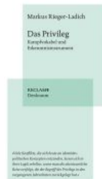
Das Privileg Ladenpreis: 16,50EUR