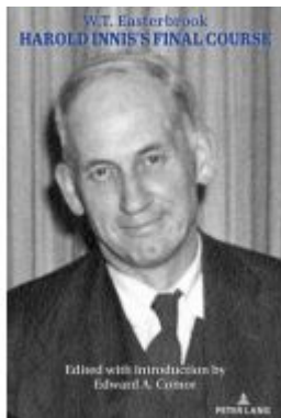
Harold Innis's Final Course Ladenpreis: 37,60EUR