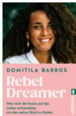
Rebel Dreamer Ladenpreis: 14,40EUR