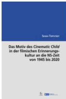
Das Motiv des Cinematic Child in der filmischen Erinnerungskultur an die NS- Zeit von 1945 bis 2020 Ladenpreis: 59,70EUR