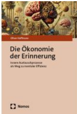
Die Ökonomie der Erinnerung Ladenpreis: 81,30EUR