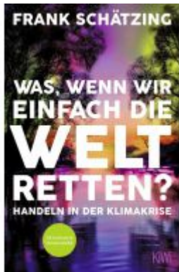
Was, wenn wir einfach die Welt retten? Ladenpreis: 13,40EUR