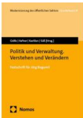
Politik und Verwaltung. Verstehen und Verändern Ladenpreis: 153,20EUR