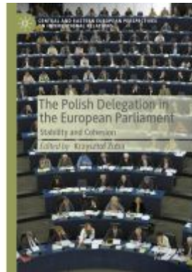
The Polish Delegation in the European Parliament Ladenpreis: 153,99EUR