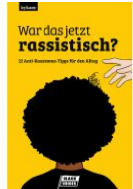
War das jetzt rassistisch? Ladenpreis: 23,50EUR