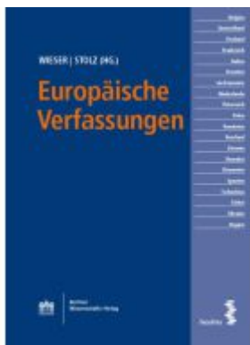
Europäische Verfassungen Ladenpreis: 29,00EUR