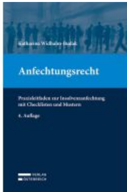
Anfechtungsrecht Ladenpreis: 49,00EUR