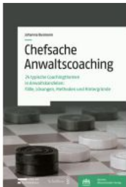
Chefsache Anwaltscoaching Ladenpreis: 83,00EUR