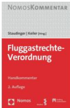
Fluggastrechte-Verordnung Ladenpreis: 80,20EUR