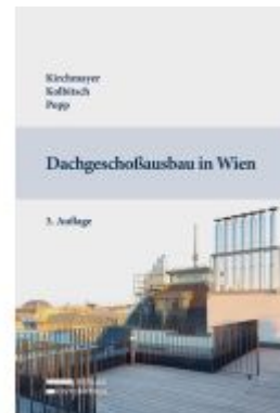
Dachgeschoßausbau in Wien Ladenpreis: 79,00EUR