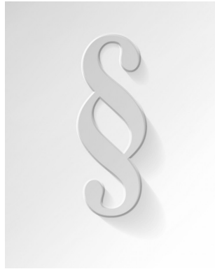
Die Einkommensteuer (EStG 1988) Band III - Kommentar Ladenpreis: 525,00EUR