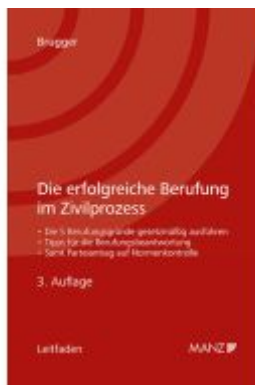
Die erfolgreiche Berufung im Zivilprozess Ladenpreis: 39,00EUR