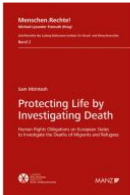
Protecting Life by Investigating Death Ladenpreis: 84,00EUR