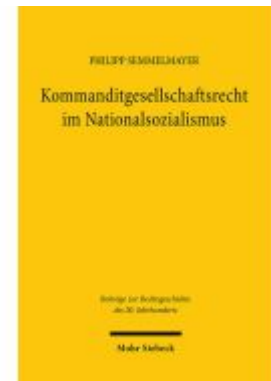
Kommanditgesellschaftsrecht im Nationalsozialismus Ladenpreis: 97,70EUR