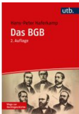
Das BGB Ladenpreis: 36,00EUR