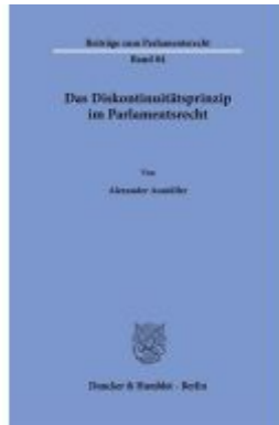
Das Diskontinuitätsprinzip im Parlamentsrecht. Ladenpreis: 92,50EUR