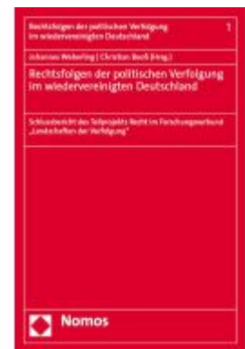
Rechtsfolgen der politischen Verfolgung im wiedervereinigten Deutschland Ladenpreis: 117,20EUR