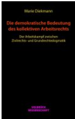
Die demokratische Bedeutung des kollektiven Arbeitsrechts Ladenpreis: 44,90EUR