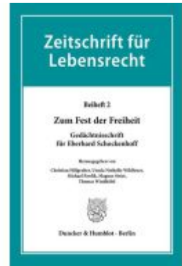
Zum Fest der Freiheit. Ladenpreis: 123,30EUR