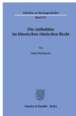
Die ratihabito im klassischen römischen Recht. Ladenpreis: 102,70EUR