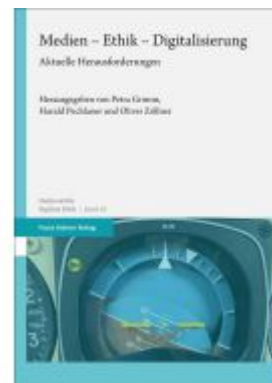
Medien – Ethik – Digitalisierung Ladenpreis: 47,30EUR