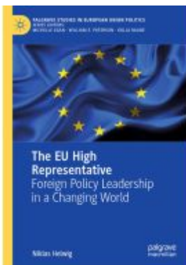
The EU High Representative Ladenpreis: 131,99EUR