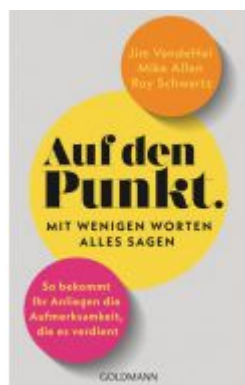
Auf den Punkt – Mit wenigen Worten alles sagen Ladenpreis: 20,60EUR