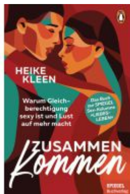
Zusammenkommen Ladenpreis: 16,50EUR

Wir haben andere Produkte gefunden, die Ihnen gefallen könnten!