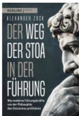
Der Weg der Stoa in der Führung Ladenpreis: 20,60EUR