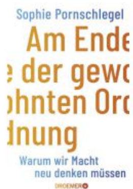
Am Ende der gewohnten Ordnung Ladenpreis: 20,60EUR