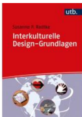
Interkulturelle Design-Grundlagen Ladenpreis: 39,00EUR