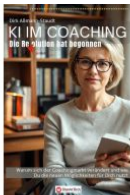
KI im Coaching - Die Revolution hat begonnen Ladenpreis: 22,60EUR