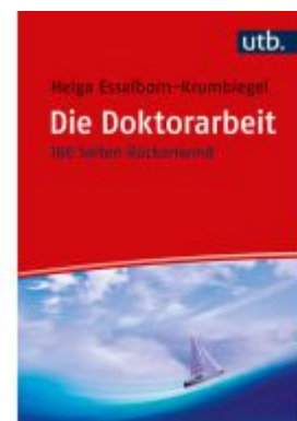
Die Doktorarbeit Ladenpreis: 20,60EUR