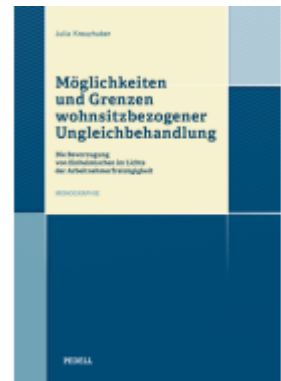
Möglichkeiten und Grenzen ohnsitzbezogener Ungleichbehandlung Ladenpreis: 50,00EUR