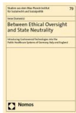
Between Ethical Oversight and State Neutrality Ladenpreis: 148,10EUR