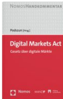
Digital Markets Act Ladenpreis: 129,00EUR