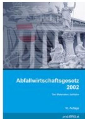
Abfallwirtschaftsgesetz 2002 Ladenpreis: 40,00EUR