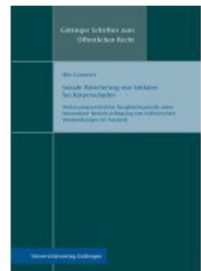
Soziale Absicherung von Soldaten bei Körperschäden Ladenpreis: 39,10EUR