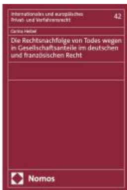
Die Rechtsnachfolge von Todes wegen in Gesellschaftsanteile im deutschen und französischen Recht Ladenpreis: 204,60EUR