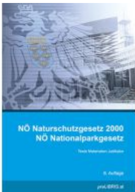
NÖ Naturschutzgesetz 2000 / NÖ Nationalparkgesetz Ladenpreis: 31,00EUR