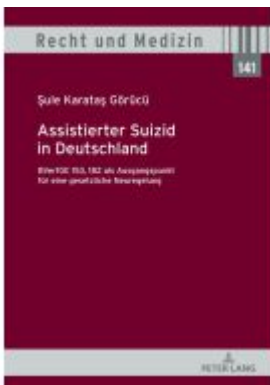
Assistierter Suizid in Deutschland, BVerfGE 153, 182 als Ausgangspunkt für eine gesetzliche Neuregelung Ladenpreis: 51,40EUR