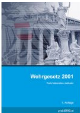
Wehrgesetz 2001 Ladenpreis: 28,00EUR

Wir haben andere Produkte gefunden, die Ihnen gefallen könnten!