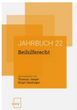
Beihilferecht Ladenpreis: 88,00EUR