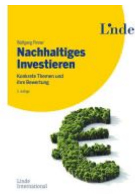
Nachhaltiges Investieren Ladenpreis: 39,00EUR