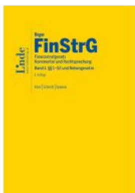
FinStrG | Finanzstrafgesetz Ladenpreis: 198,00EUR