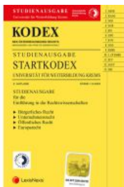
KODEX Startkodex Krems 2023/24 - inkl. App Ladenpreis: 28,00EUR