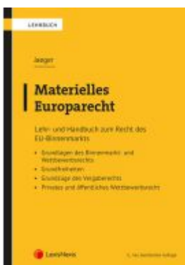
Materielles Europarecht Ladenpreis: 74,00EUR