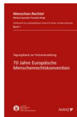
70 Jahre Europäische Menschenrechtskonvention Ladenpreis: 42,00EUR