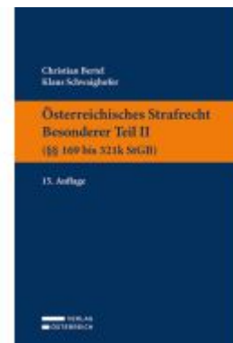
Österreichisches Strafrecht. Besonderer Teil II (§§ 169 bis 321k StGB) Ladenpreis: 39,00EUR