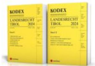
KODEX Landesrecht Tirol 2024 Ladenpreis: 135,00EUR

Wir haben andere Produkte gefunden, die Ihnen gefallen könnten!