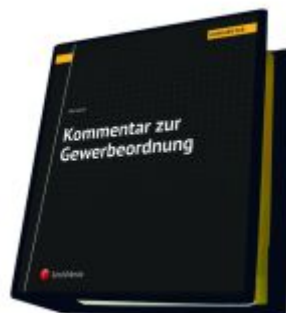
Kommentar zur Gewerbeordnung Ladenpreis: 455,00EUR