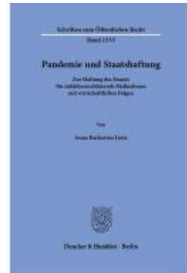
Pandemie und Staatshaftung Ladenpreis: 102,70EUR