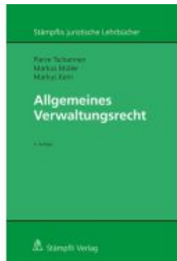
Allgemeines Verwaltungsrecht Ladenpreis: 110,60EUR