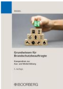
Grundwissen für Brandschutzbeauftragte Ladenpreis: 30,70EUR

Wir haben andere Produkte gefunden, die Ihnen gefallen könnten!