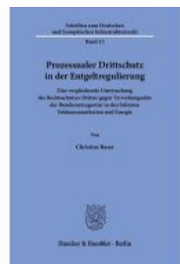
Prozessualer Drittschutz in der Entgeltregulierung. Ladenpreis: 123,30EUR