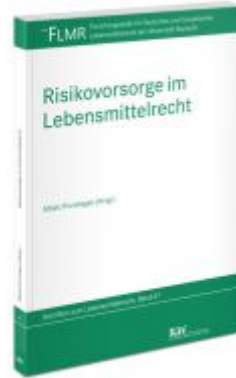
Risikovorsorge im Lebensmittelrecht Ladenpreis: 71,00EUR