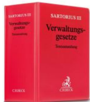
Verwaltungs-gesetze Ladenpreis: 50,40EUR