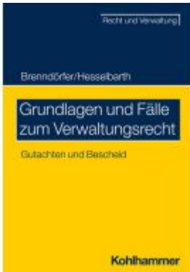
Grundlagen und Fälle zum Verwaltungsrecht Ladenpreis: 40,10EUR