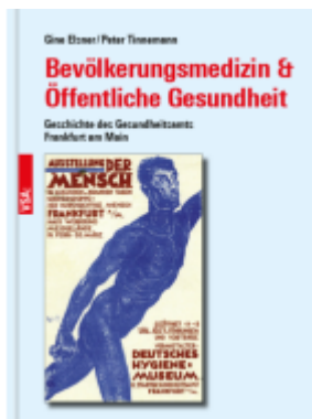
Bevölkerungsmedizin & Öffentliche Gesundheit Ladenpreis: 25,50EUR

Wir haben andere Produkte gefunden, die Ihnen gefallen könnten!