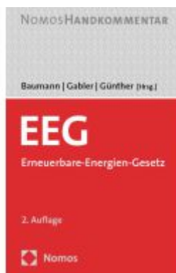
EEG Ladenpreis: 183,00EUR