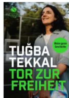
Tor zur Freiheit Ladenpreis: 22,70EUR