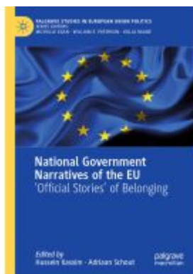
National Government Narratives of the EU Ladenpreis: 142,99EUR