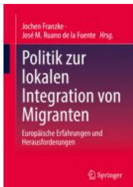
Politik zur lokalen Integration von Migranten Ladenpreis: 77,09EUR