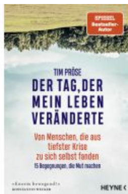
Der Tag, der mein Leben veränderte Ladenpreis: 20,60EUR