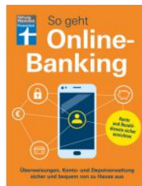
So geht Onlinebanking Ladenpreis: 23,60EUR