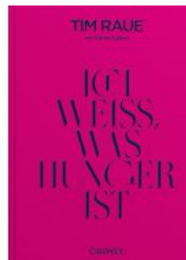
Ich weiß, was Hunger ist Ladenpreis: 30,80EUR