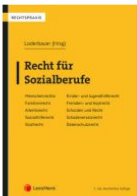
Recht für Sozialberufe Ladenpreis: 69,00EUR