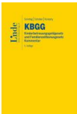
KBGG | Kinderbetreuungsgeldgesetz und Familienzeitbonusgesetz Ladenpreis: 56,00EUR