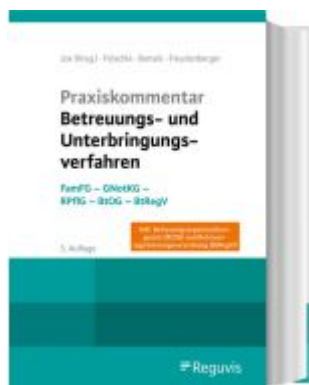
Praxiskommentar Betreuungs- und Unterbringungsverfahren Ladenpreis: 101,80EUR