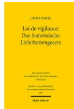
Loi de vigilance: Das französische Lieferkettengesetz Ladenpreis: 86,40EUR