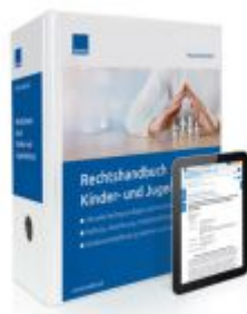
Rechtshandbuch Kinder- und Jugendschutz Ladenpreis: 239,80EUR