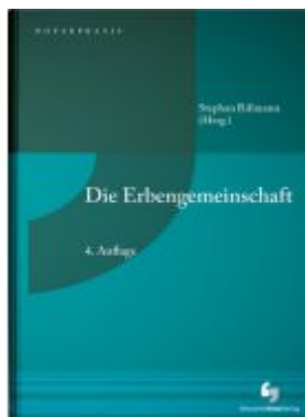
Die Erbengemeinschaft Ladenpreis: 142,90EUR