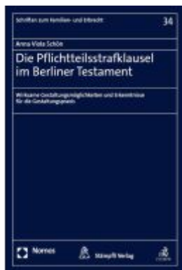
Die Pflichtteilsstrafklausel im Berliner Testament Ladenpreis: 86,40EUR