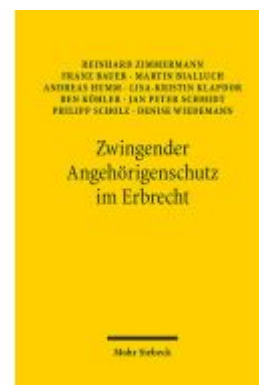
Zwängender Angehörigenschutz im Erbrecht Ladenpreis: 60,70EUR