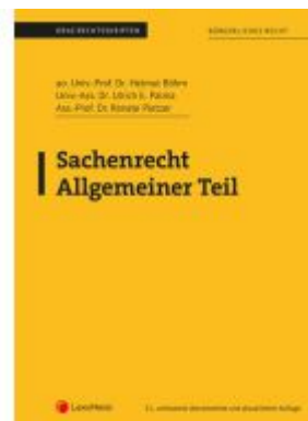
Sachenrecht Allgemeiner Teil (Skriptum) Ladenpreis: 23,75EUR