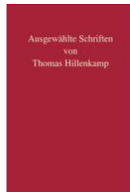
Ausgewählte Schriften von Thomas Hillenkamp Ladenpreis: 287,90EUR