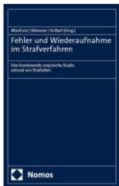
Fehler und Wiederaufnahme im Strafverfahren Ladenpreis: 112,10EUR