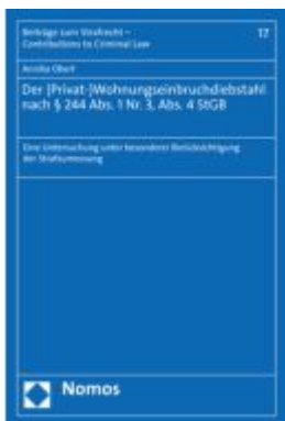
Der (Privat-)Wohnungseinbruchdiebstahl nach § 244 Abs. 1 Nr. 3, Abs. 4 StGB Ladenpreis: 112,10EUR