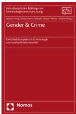
Gender & Crime Ladenpreis: 65,80EUR