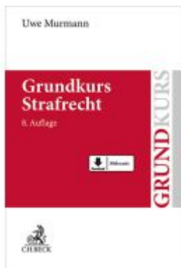
Grundkurs Strafrecht Ladenpreis: 33,90EUR

Wir haben andere Produkte gefunden, die Ihnen gefallen könnten!