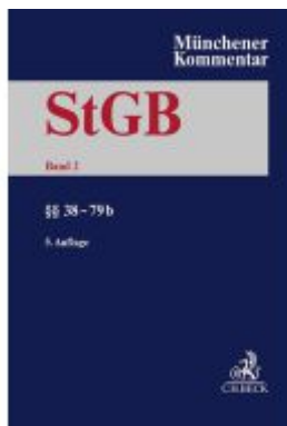
Münchener Kommentar zum Strafgesetzbuch Bd. 2: §§ 38-79b Ladenpreis: 379,40EUR