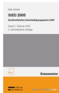
StEG 2005 Strafrechtliches Entschädigungsgesetz 2005 Ladenpreis: 58,00EUR