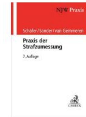
Praxis der Strafzumessung Ladenpreis: 122,40EUR