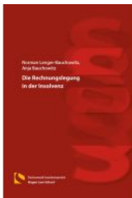
Die Rechnungslegung in der Insolvenz Ladenpreis: 25,70EUR