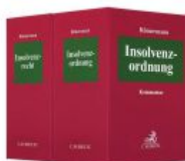
Insolvenzordnung (InsO) / Insolvenzrecht (InsR) Ladenpreis: 112,10EUR