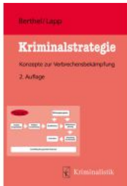
Kriminalstrategie Ladenpreis: 28,80EUR