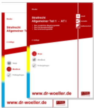
Paket Skript & MindBook - Strafrecht Allgemeiner Teil 1 – AT I Ladenpreis: 41,10EUR