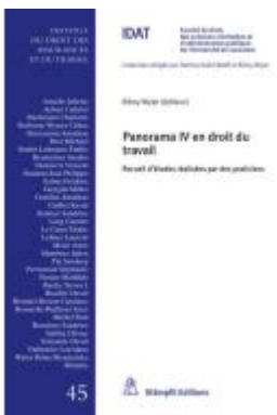
Panorama IV en droit du travail Ladenpreis: 190,50EUR