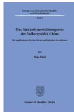
Das Auslandsinvestitionsgesetz der Volksrepublik China Ladenpreis: 102,70EUR