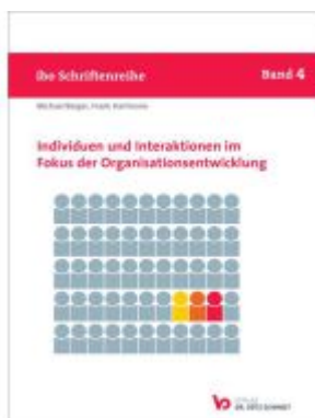
Individuen und Interaktionen im Fokus der Organisationsentwicklung Ladenpreis: 39,10EUR