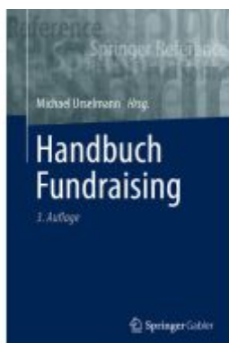
Handbuch Fundraising Ladenpreis: 133,63EUR