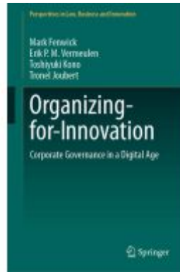
Organizing-for-Innovation Ladenpreis: 142,99EUR