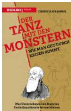
Der Tanz mit den Monstern – Wie man gut durch Krisen kommt Ladenpreis: 22,70EUR