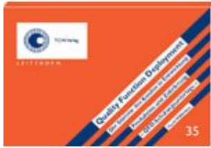
Quality Function Deployment Ladenpreis: 350,00EUR