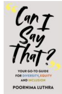
Can I Say That? Ladenpreis: 16,05EUR