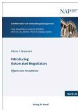
Introducing Automated Negotiators Ladenpreis: 79,00EUR