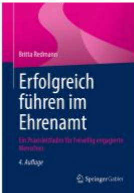
Erfolgreich führen im Ehrenamt Ladenpreis: 46,25EUR