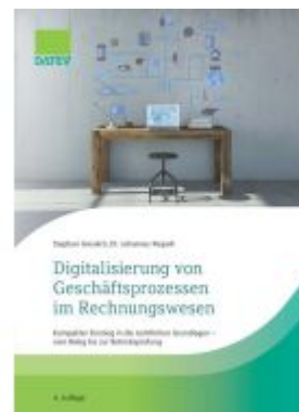
Digitalisierung von Geschäftsprozessen im Rechnungswesen Ladenpreis: 25,75EUR