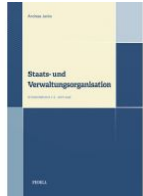
Staats- und Verwaltungsorganisation Ladenpreis: 30,00 EUR