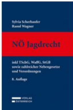
Nö Jagdrecht Ladenpreis: 189,00 EUR