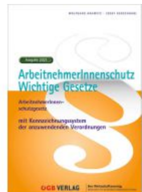
ArbeitnehmerInnenschutz. Ladenpreis: 39,90 EUR