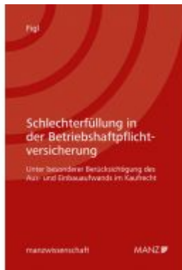
Schlechterfüllung in der Betriebshaftpflichtversicherung Ladenpreis: 44,00 EUR

Wir haben andere Produkte gefunden, die Ihnen gefallen könnten!