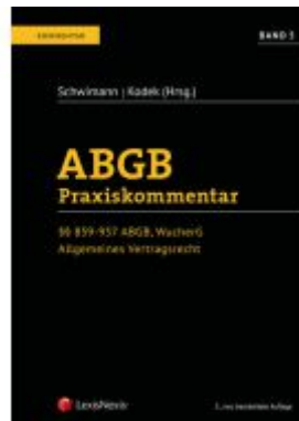
ABGB Praxiskommentar / ABGB Praxiskommentar - Band 5, 5. Auflage Ladenpreis: 289,00 EUR