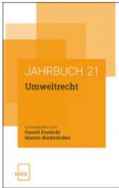
Umweltrecht Ladenpreis: 54,80 EUR