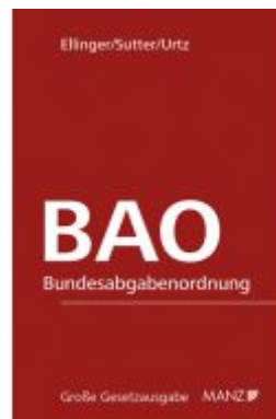
Bundesabgabenordnung - BAO Ladenpreis: 348,00 EUR