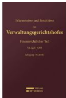
Erkenntnisse und Beschlüsse des Verwaltungsgerichtshofes Ladenpreis: 148,00 EUR