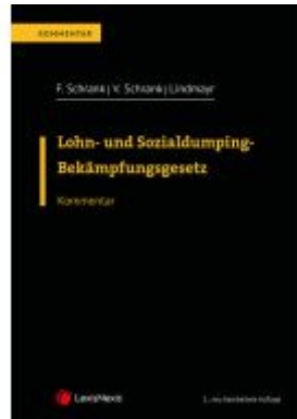
Lohn- und Sozialdumping- Bekämpfungsgesetz LSD-BG Ladenpreis: 148,00 EUR