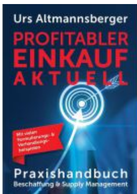
Profitabler Einkauf aktuell - Praxishandbuch Beschaffung und Supply Management Ladenpreis: 27,80EUR

Wir haben andere Produkte gefunden, die Ihnen gefallen könnten!