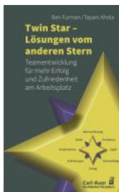
Twin Star - Lösungen vom anderen Stern Ladenpreis: 20,60EUR