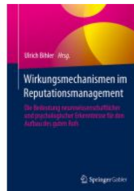
Wirkungsmechanismen im Reputationsmanagement Ladenpreis: 46,25EUR