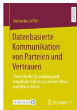
Datenbasierte Kommunikation von Parteien und Vertrauen Ladenpreis: 77,09EUR