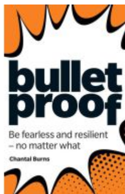
Bulletproof: Be fearless and resilient, no matter what Ladenpreis: 16,04EUR