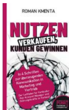
Nutzen verkaufen, Kunden gewinnen Ladenpreis: 15,98EUR