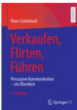
Verkaufen, Flirten, Führen Ladenpreis: 46,25EUR