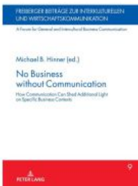
No Business without Communication Ladenpreis: 113,10EUR