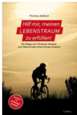
Hilf mir, meinen Lebenstraum zu erfüllen! Ladenpreis: 19,90 EUR