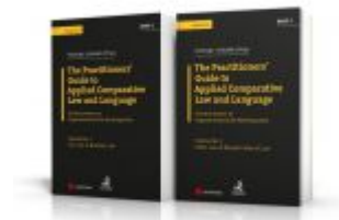
Angloamerikanische Rechtssprache / PAKET: The Practitioners' Guide to Applied Comparative Law and Language Ladenpreis: 142,40 EUR