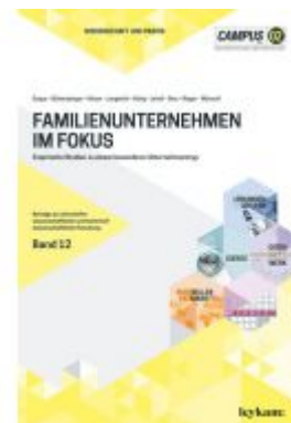
Familienunternehmen im Fokus. Empirische Studien zu einem besonderen Unternehmenstyp Ladenpreis: 17,00 EUR