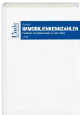
Immobilienkennzahlen Ladenpreis: 89,00 EUR

Wir haben andere Produkte gefunden, die Ihnen gefallen könnten!