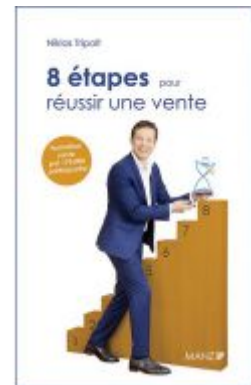
8 étapes pour réussir une vente Ladenpreis: 28,90 EUR