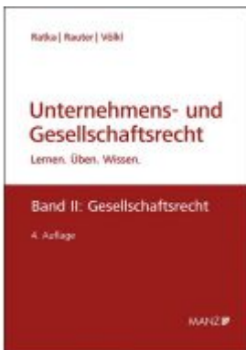
Unternehmens- und Gesellschaftsrecht Ladenpreis: 63,00 EUR