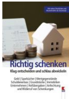
Richtig schenken Ladenpreis: 19,90 EUR