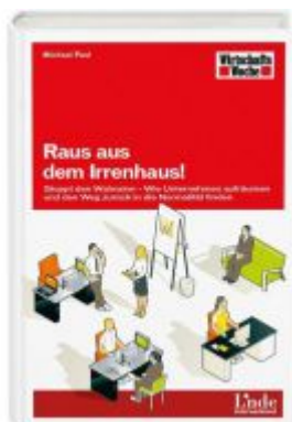
Raus aus dem Irrenhaus! Ladenpreis: 19,90 EUR