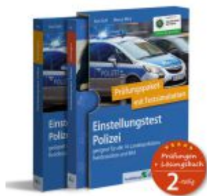
Einstellungstest Polizei: Prüfungspaket mit Testsimulation Ladenpreis: 35,90EUR