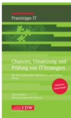
Chancen, Umsetzung und Prüfung von IT- Strategien Ladenpreis: 55,60EUR