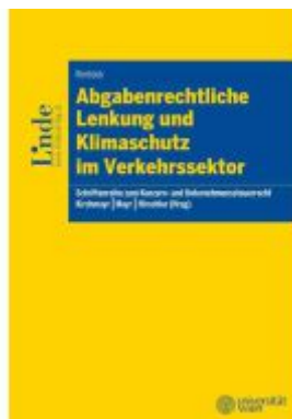
Abgabenrechtliche Lenkung und Klimaschutz im Verkehrssektor Ladenpreis: 72,00EUR