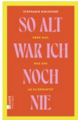
So alt war ich noch nie Ladenpreis: 23,70EUR