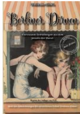
Berliner Dirnen Ladenpreis: 20,60EUR