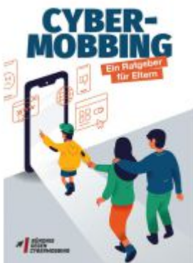
Cybermobbing Ladenpreis: 15,40EUR

Wir haben andere Produkte gefunden, die Ihnen gefallen könnten!