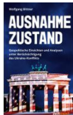
Ausnahmezustand Ladenpreis: 20,50EUR