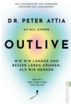
OUTLIVE Ladenpreis: 20,60EUR