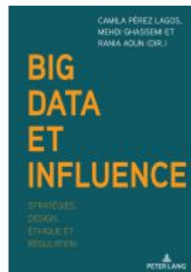
Big Data et influence Ladenpreis: 45,10EUR