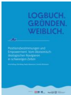
Logbuch. Gründen. Weiblich. Ladenpreis: 20,40EUR

Wir haben andere Produkte gefunden, die Ihnen gefallen könnten!