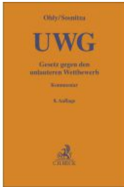
Gesetz gegen den unlauteren Wettbewerb Ladenpreis: 142,90EUR