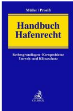
Handbuch Hafenrecht Ladenpreis: 204,60EUR