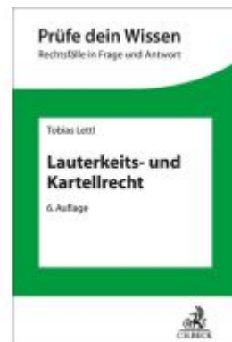
Lauterkeits- und Kartellrecht Ladenpreis: 29,80EUR