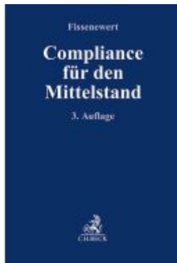
Compliance für den Mittelstand Ladenpreis: 87,40EUR