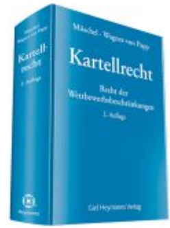
Kartellrecht Ladenpreis: 172,80EUR