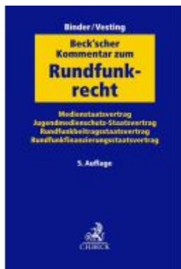
Beck'scher Kommentar zum Rundfunkrecht Ladenpreis: 276,60EUR