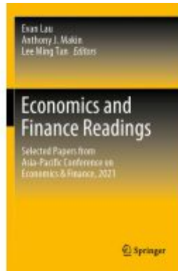
Economics and Finance Readings Ladenpreis: 197,99EUR