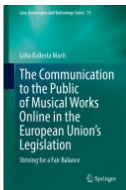
The Communication to the Public of Musical Works Online in the European Union's Legislation Ladenpreis: 164,99EUR