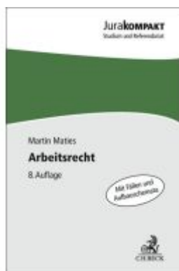
Arbeitsrecht Ladenpreis: 15,40EUR