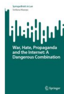
War, Hate, Propaganda and the Internet: A Dangerous Combination Ladenpreis: 49,49EUR