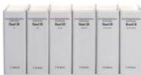
Baugesetzbuch Ladenpreis: 204,60EUR