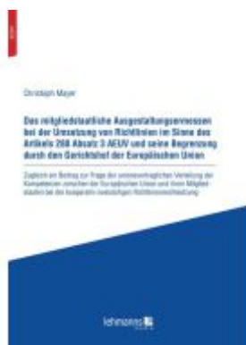
Das mitgliedstaatliche Ausgestaltungsmessen bei der Umsetzung von Richtlinien im Sinne des Artikels 288 Absatz 3 AEUV und seine Begrenzung durch den Gerichtshof der Europäischen Union Ladenpreis: 20,60EUR