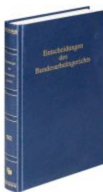
Entscheidungen des Bundesarbeitsgerichts (BAGE 182) Ladenpreis: 100,80EUR