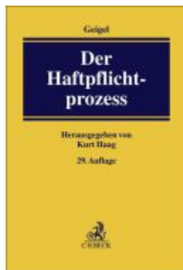
Der Haftpflichtprozess Ladenpreis: 204,60EUR