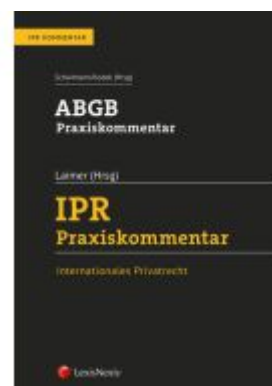
ABGB Praxiskommentar / IPR Praxiskommentar Ladenpreis: 360,00EUR