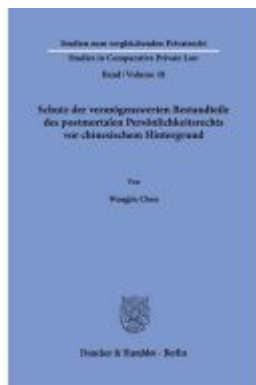
Schutz der vermögenswerten Bestandteile des postmortalen Persönlichkeitsrechts vor chinesischem Hintergrund. Ladenpreis: 71,90EUR