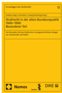
Strafrecht in der alten Bundesrepublik 1949-1990 Besonderer Teil Ladenpreis: 149,00EUR