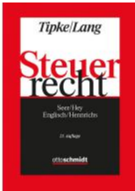
Steuerrecht Ladenpreis: 71,80EUR