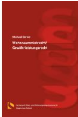
Wohnraummietrecht/Gewährleistungsrecht Ladenpreis: 25,70EUR