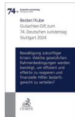
Verhandlungen des 74. Deutschen Juristentages Stuttgart 2024 Bd. I: Gutachten Teil D/E: Bewältigung zukünftiger Krisen: Welche gesetzlichen Rahmenbedingungen werden benötigt, um effizient und effektiv zu reagieren und finanzielle Hilfen bedarfsgerec... Ladenpreis: 29,90EUR