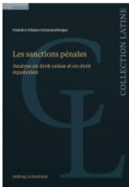
Les sanctions pénales Ladenpreis: 141,00EUR

Wir haben andere Produkte gefunden, die Ihnen gefallen könnten!