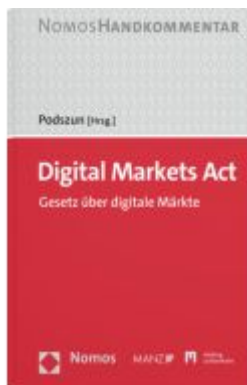
Digital Markets Act Ladenpreis: 129,00EUR