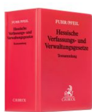
Hessische Verfassungs- und Verwaltungsgesetze Ladenpreis: 40,10EUR