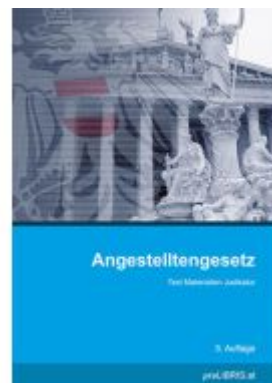
Angestelltengesetz Ladenpreis: 23,00EUR