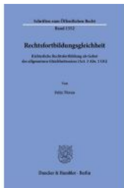
Rechtsfortbildungsgleichheit Ladenpreis: 82,20EUR