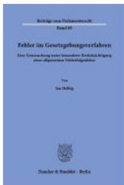
Fehler im Gesetzgebungsverfahren. Ladenpreis: 102,70EUR