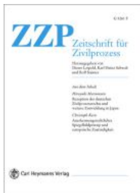
Zeitschrift für Zivilprozess International. ZYP Int. Jahrbuch des... / Zeitschrift für Zivilprozess International. Ladenpreis: 150,10EUR