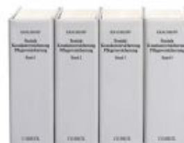
Soziale Krankenversicherung, Pflegeversicherung Ladenpreis: 122,40EUR