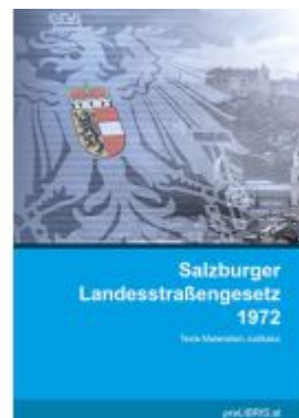
Salzburger Landesstraßengesetz 1972 Ladenpreis: 20,00EUR