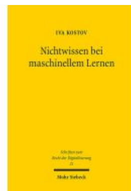
Nichtwissen bei maschinellem Lernen Ladenpreis: 96,70EUR