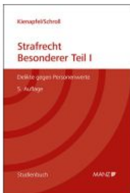
Strafrecht - Besonderer Teil I Ladenpreis: 61,00EUR

Wir haben andere Produkte gefunden, die Ihnen gefallen könnten!