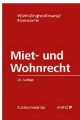
Miet- und Wohnrecht Ladenpreis: 188,00EUR