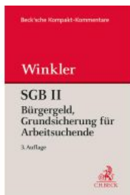
SGB II Bürgergeld. Grundsicherung für Arbeitsuchende Ladenpreis: 101,80EUR