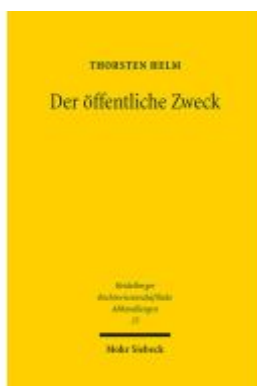
Der öffentliche Zweck Ladenpreis: 122,40EUR