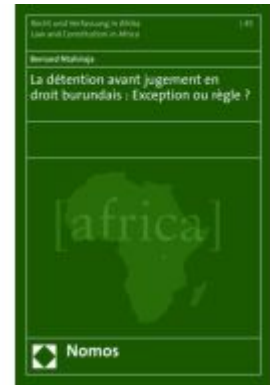
La détention avant jugement en droit burundais : Exception ou règle ? Ladenpreis: 199,50EUR