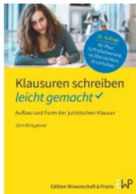
Klausuren schreiben – leicht gemacht Ladenpreis: 15,40EUR