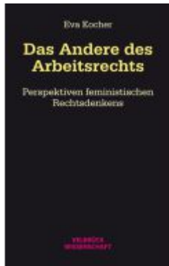
Das Andere des Arbeitsrechts Ladenpreis: 39,90EUR