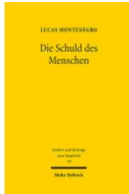
Die Schuld des Menschen Ladenpreis: 86,40EUR