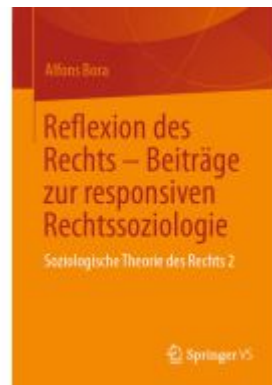
Reflexion des Rechts – Beiträge zur responsiven Rechtssoziologie Ladenpreis: 41,11EUR