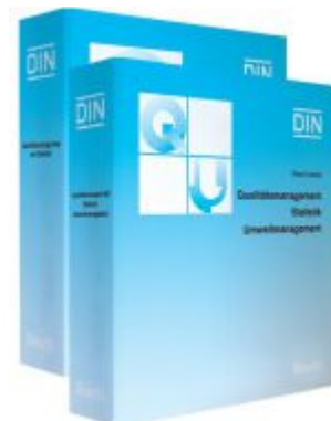
Qualitätsmanagement, Statistik, Umweltmanagement. Teil A, Teil B/C, Teil D und Teil E / Qualitätsmanagement - Statistik - Umweltmanagement. Teil A und Teil B/C Ladenpreis: 347,50EUR