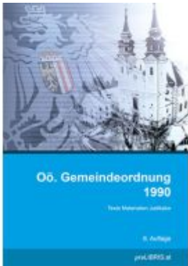
Oö. Gemeindeordnung 1990 Ladenpreis: 28,00EUR