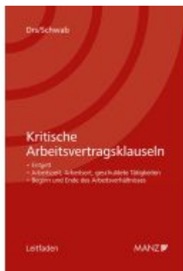
Kritische Arbeitsvertragsklauseln Ladenpreis: 138,00EUR