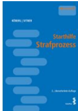
Starthilfe Strafprozess Ladenpreis: 26,00EUR