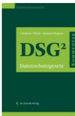
Praxiskommentar zum Datenschutzgesetz (DSG) Ladenpreis: 178,00EUR