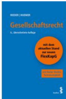
Gesellschaftsrecht Ladenpreis: 52,00EUR