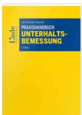
Praxishandbuch Unterhaltsbemessung Ladenpreis: 42,00EUR