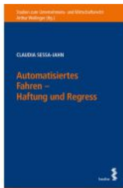
Automatisiertes Fahren – Haftung und Regress Ladenpreis: 52,00EUR