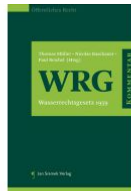
WRG - Kommentar zum Wasserrechtsgesetz Ladenpreis: 268,00EUR