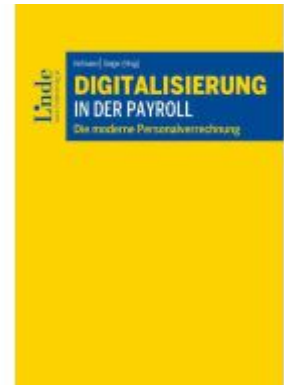
Digitalisierung in der Payroll Ladenpreis: 49,00EUR