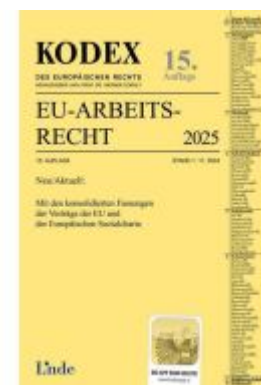
KODEX EU-Arbeitsrecht 2025 Ladenpreis: 73,00EUR