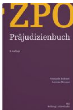
ZPO Präjudizienbuch Ladenpreis: 295,00EUR