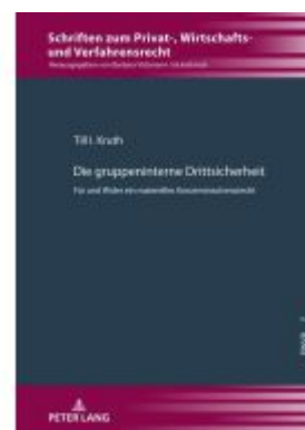
Die gruppeninterne Drittsicherheit Ladenpreis: 56,50EUR