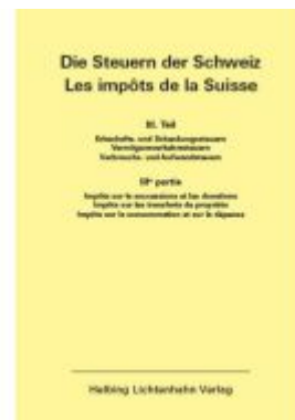
Die Steuern der Schweiz: Teil III EL 147 Ladenpreis: 141,00EUR