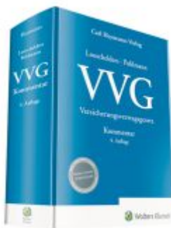
Versicherungsvertragsgesetz ( VVG ) Ladenpreis: 173,80EUR