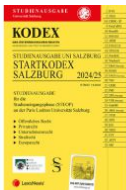
KODEX Startkodex Salzburg 2024/25 - inkl. App Ladenpreis: 21,00EUR