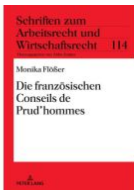
Die französischen Conseils de Prud'hommes Ladenpreis: 56,50EUR