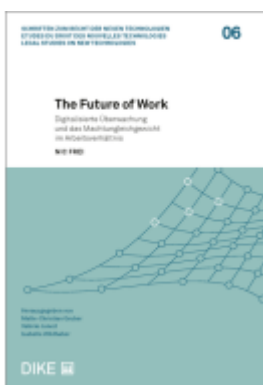
The Future of Work Ladenpreis: 92,00EUR