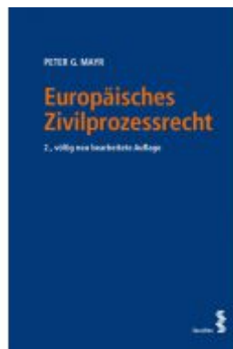
Europäisches Zivilprozessrecht Ladenpreis: 58,00 EUR