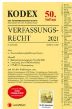
KODEX Verfassungsrecht 2021 Ladenpreis: 40,00 EUR