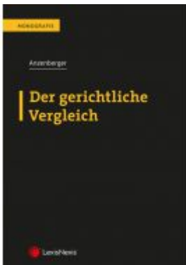
Der gerichtliche Vergleich Ladenpreis: 85,00 EUR

Wir haben andere Produkte gefunden, die Ihnen gefallen könnten!