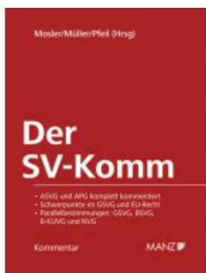
Der SV-Komm Ladenpreis: 398,00 EUR