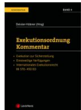
Exekutionsordnung - Kommentar Band 4 Ladenpreis: 128,80 EUR