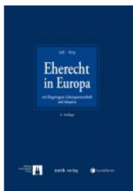
Eherecht in Europa Ladenpreis: 169,00 EUR