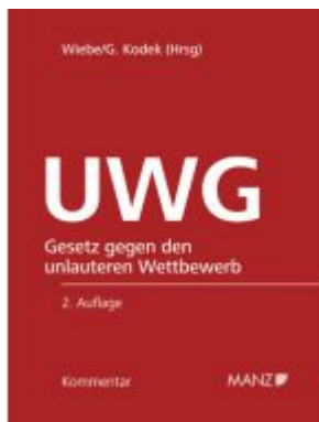
Kommentar zum UWG 2.Auflage Ladenpreis: 298,00 EUR