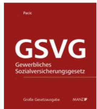
Die Sozialversicherung der in der gewerblichen Wirtschaft selbständig Erwerbstätigen - GSVG Ladenpreis: 298,00 EUR