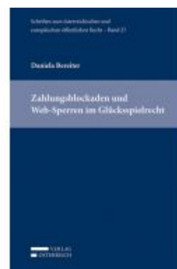
Zahlungsblockaden und Web-Sperren im Glücksspielrecht Ladenpreis: 86,00 EUR