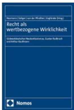
Recht als wertbezogene Wirklichkeit Ladenpreis: 81,30EUR