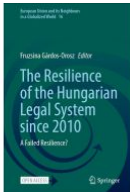
The Resilience of the Hungarian Legal System since 2010 Ladenpreis: 54,99EUR