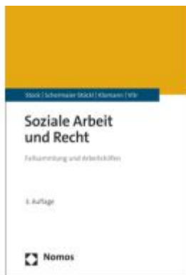
Soziale Arbeit und Recht Ladenpreis: 29,90EUR