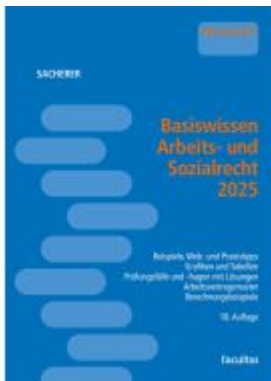
Basiswissen Arbeits- und Sozialrecht 2025 Ladenpreis: 40,00EUR