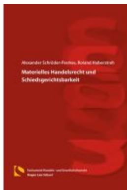
Materielles Handelsrecht und Schiedsgerichtsbarkeit Ladenpreis: 19,50EUR