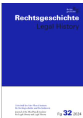
Rechtsgeschichte Legal History (RG). Zeitschrift des Max Planck-Instituts für Rechtsgeschichte und Rechtstheorie/Rechtsgeschichte Legal History Ladenpreis: 50,40EUR