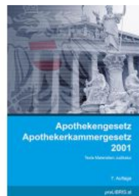
Apothekengesetz / Apothekerkammergesetz 2001 Ladenpreis: 34,00EUR