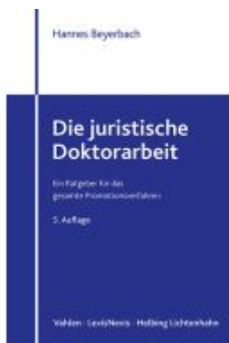
Die juristische Doktorarbeit Ladenpreis: 23,70EUR