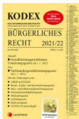
KODEX Bürgerliches Recht 2021/22 - inkl. App Ladenpreis: 36,00 EUR