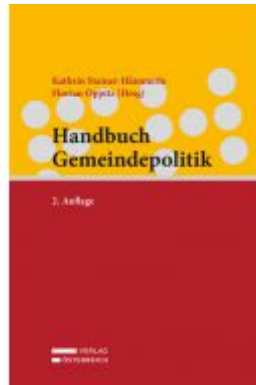
Handbuch Gemeindepolitik Ladenpreis: 68,00 EUR