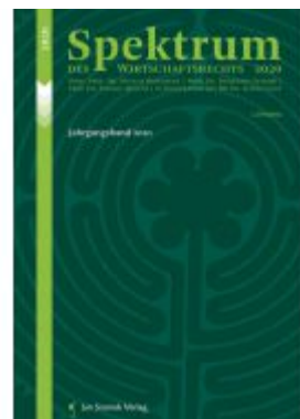
Spektrum des Wirtschaftsrechts Ladenpreis: 85,00 EUR