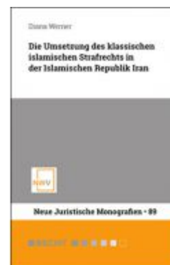
Die Umsetzung des klassischen islamischen Strafrechts in der Islamischen Republik Iran Ladenpreis: 48,00 EUR