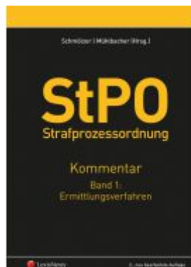
StPO Strafprozessordnung - Kommentar Band 1: Ermittlungsverfahren Ladenpreis: 292,00 EUR