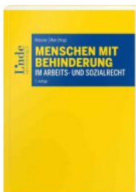
Menschen mit Behinderung im Arbeits- und Sozialrecht Ladenpreis: 35,00 EUR