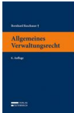
Allgemeines Verwaltungsrecht Ladenpreis: 49,00 EUR