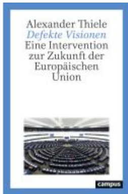
Defekte Visionen Ladenpreis: 22,70EUR