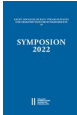
Symposium 2022 Ladenpreis: 120,00EUR