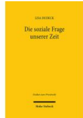
Die soziale Frage unserer Zeit Ladenpreis: 86,40EUR