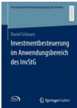
Investmentbesteuerung im Anwendungsbereich des InvStG Ladenpreis: 113,07EUR