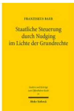
Staatliche Steuerung durch Nudging im Lichte der Grundrechte Ladenpreis: 91,50EUR