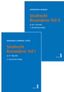
Kombipaket Strafrecht Besonderer Teil I und Besonderer Teil II Ladenpreis: 82,00EUR