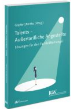
Talents - Außertarifliche Angestellte Ladenpreis: 50,40EUR