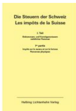
Die Steuern der Schweiz: Teil I EL 167 Ladenpreis: 113,00EUR