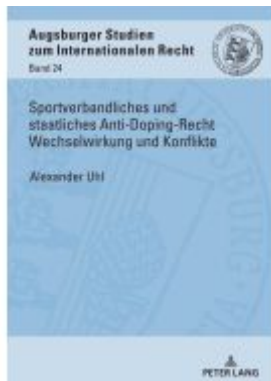
Sportverbandliches und staatliches Anti-Doping-Recht Wechselwirkung und Konflikte Ladenpreis: 67,80EUR