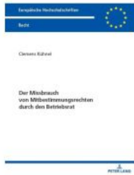
Der Missbrauch von Mitbestimmungsrechten durch den Betriebsrat Ladenpreis: 41,10EUR