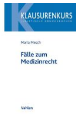
Fälle zum Medizinrecht Ladenpreis: 30,70EUR