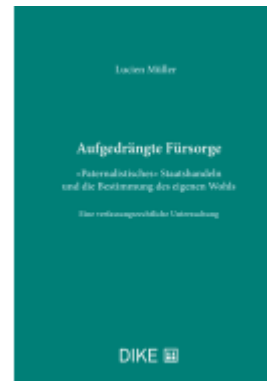
Aufgedrängte Fürsorge Ladenpreis: 184,00EUR