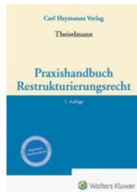
Praxishandbuch Restrukturierungsrecht Ladenpreis: 204,60EUR