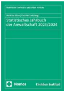
Statistisches Jahrbuch der Anwaltschaft 2023/2024 Ladenpreis: 91,50EUR