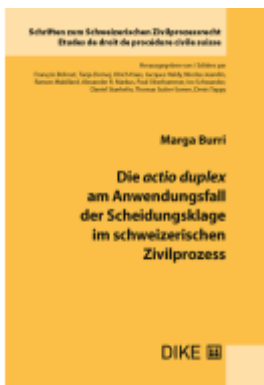
Die actio duplex am Anwendungsfall der Scheidungsklage im Schweizerischen Zivilprozess Ladenpreis: 126,00EUR