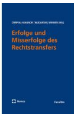
Erfolge und Misserfolge des Rechtstransfers Ladenpreis: 94,00EUR