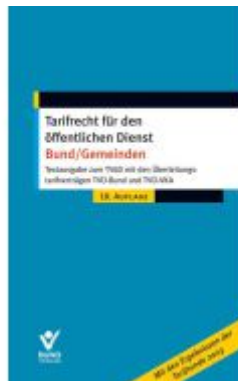
Tarifrecht für den öffentlichen Dienst - Bund/Gemeinden Ladenpreis: 20,50EUR