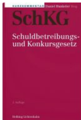
Kurzkommentar SchKG Ladenpreis: 361,00EUR