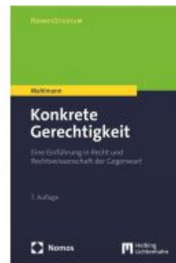
Konkrete Gerechtigkeit Ladenpreis: 30,00EUR