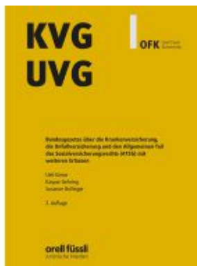
KVG/UVG Kommentar Ladenpreis: 203,60EUR