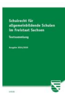
Schulrecht für allgemeinbildende Schulen im Freistaat Sachsen Ladenpreis: 18,00EUR