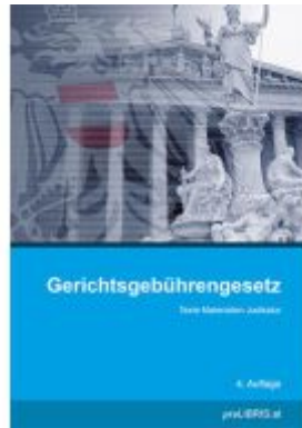
Gerichtsgebührengesetz Ladenpreis: 28,00EUR