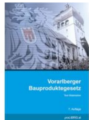
Vorarlberger Bauproduktengesetz Ladenpreis: 15,00EUR