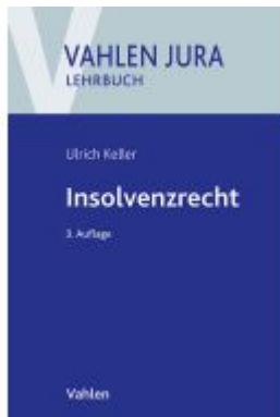
Insolvenzrecht Ladenpreis: 60,70EUR