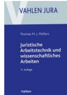
Juristische Arbeitstechnik und wissenschaftliches Arbeiten Ladenpreis: 25,60EUR