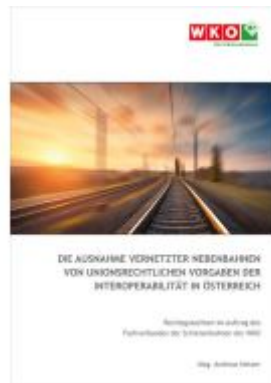
Die Ausnahme vernetzter Nebenbahnen von unionsrechtlichen Vorgaben der Interoperabilität in Österreich Ladenpreis: 22,00EUR