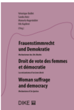
Frauenstimmrecht und Demokratie Ladenpreis: 68,00EUR