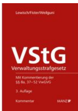
Verwaltungsstrafgesetz - VStG Ladenpreis: 138,00EUR