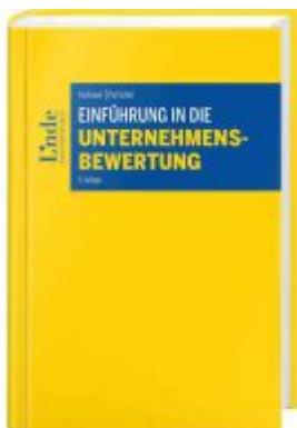
Einführung in die Unternehmensbewertung Ladenpreis: 85,00EUR