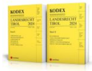
KODEX Landesrecht Tirol 2024 Ladenpreis: 135,00EUR