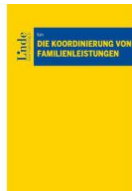
Die Koordinierung von Familienleistungen Ladenpreis: 48,00EUR