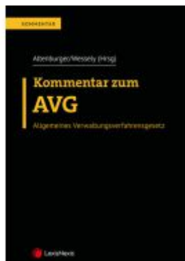
Kommentar zum AVG Ladenpreis: 218,00EUR