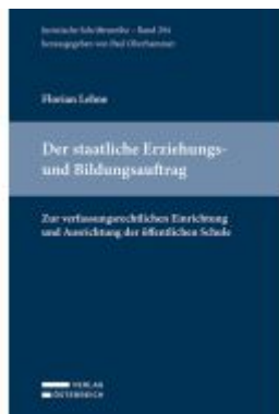
Der staatliche Erziehungs- und Bildungsauftrag Ladenpreis: 72,00EUR

Wir haben andere Produkte gefunden, die Ihnen gefallen könnten!