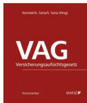
VAG - Versicherungsaufsichtsgesetz Ladenpreis: 348,00EUR