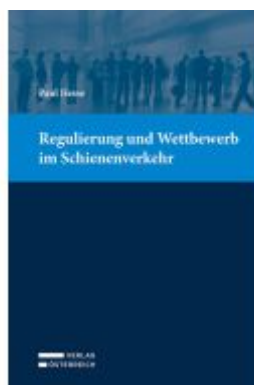
Regulierung und Wettbewerb im Schienenverkehr Ladenpreis: 74,00EUR