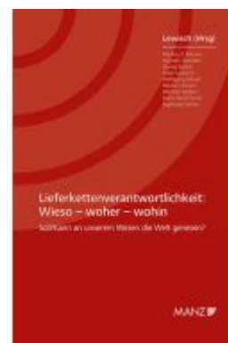
Lieferkettenverantwortlichkeit Wieso - woher - wohin Ladenpreis: 48,00EUR